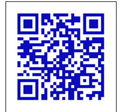
JF 求人サイト QR コード